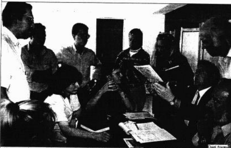
Un grupo de congresistas examina alguna documentación que manejan en el 'ovni-forum'.

Denuncian una campaña "para que la gente crea que el fenómeno ovni es cosa de 4 loquitos"